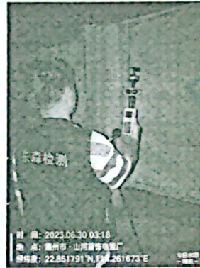
图 8: 厂界东北侧外 1m 处 4#