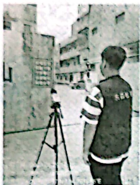
图 1: 厂界东南侧外 1m 处 1#