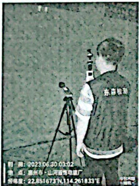
图 6: 厂界西南侧外 1m 处 2#