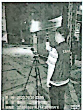
图 5: 厂界东南侧外 1m 处 1#