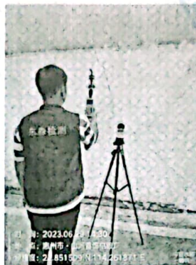
图 3: 厂界西北侧外 1m 处 3#