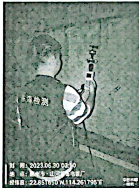
图 7: 厂界西北侧外 1m 处 3#