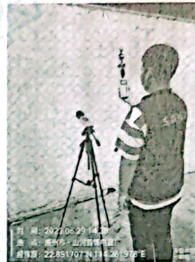
图 4: 厂界东北侧外 1m 处 4#