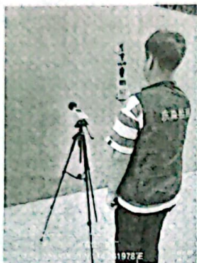
图 2: 厂界西南侧外 1m 处 2#