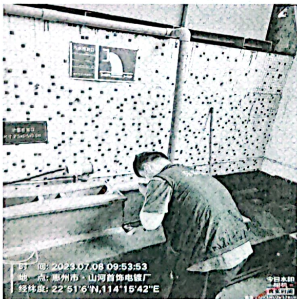
图 1: 废水排放口