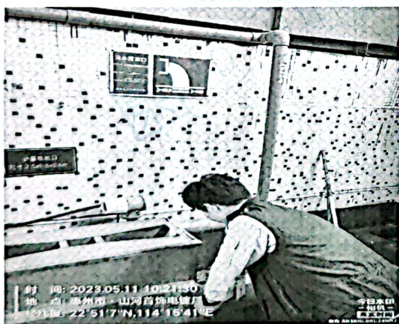
图 1: 废水排放口