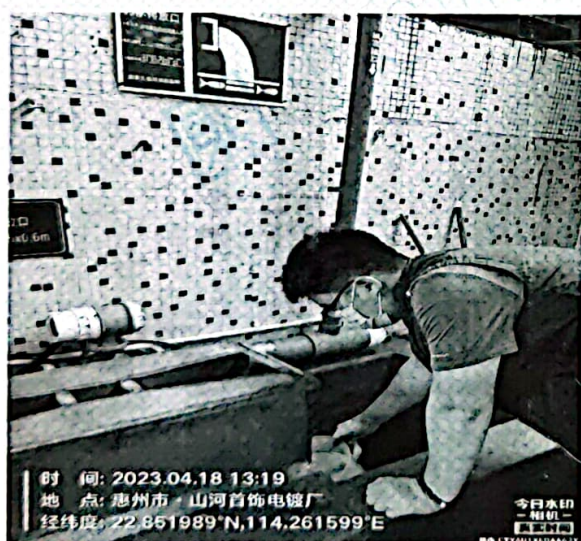
图 1: 废水排放口