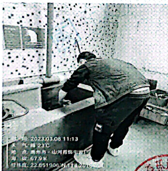
图 1: 废水排放口