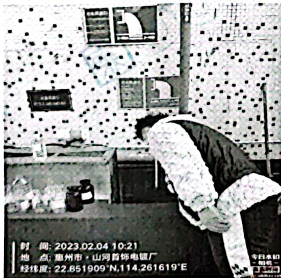
图 1: 废水排放口