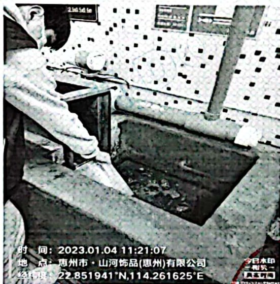
图 1: 废水排放口