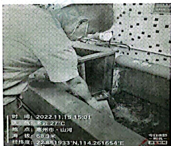
图 1: 废水排放口