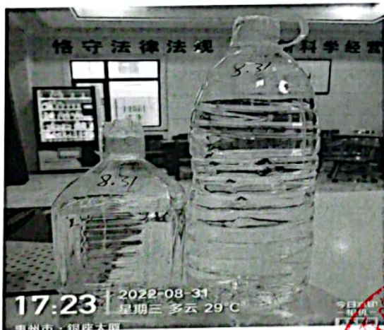
图 1: 送检样品