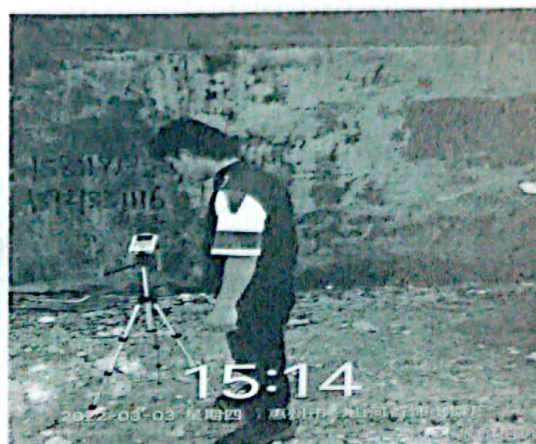
图 2: 厂界东南侧外 1m 处 2#