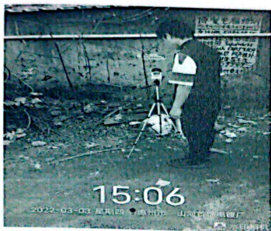
图 1: 厂界东北侧外 1m 处 1#