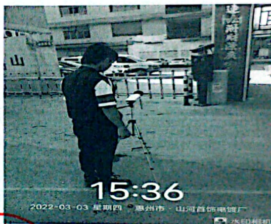
图 4: 厂界西北侧外 1m 处 4#