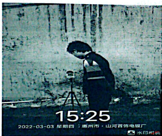
图 3: 厂界西南侧外 1m 处 3#