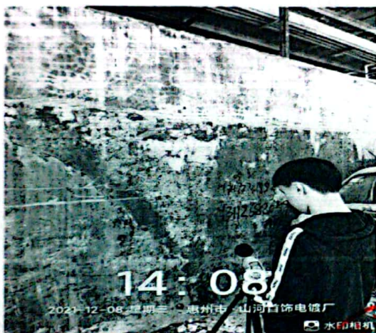
图 3: 厂界西南侧外 1m 处 3#