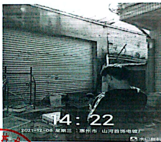
图 4: 厂界西北侧外 1m 处 4#