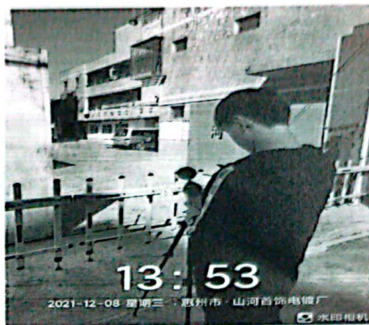
图 2: 厂界东南侧外 1m 处 2#