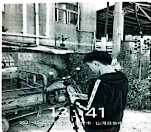
图 1: 厂界东北侧外 1m 处 1#