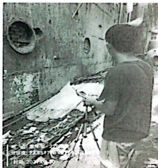
图 2: 厂界西南侧外 1m 处 2#