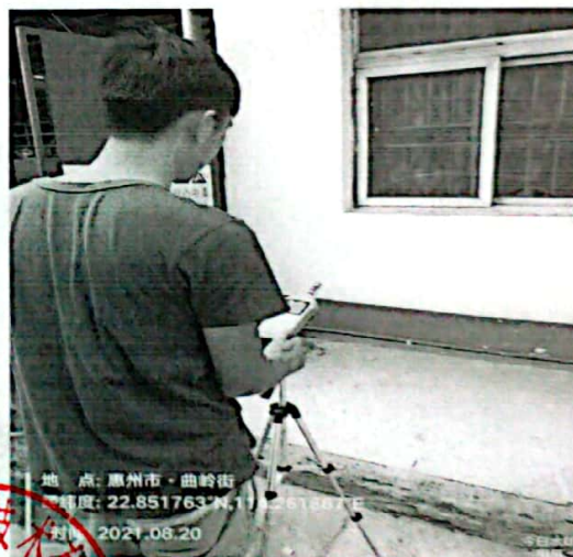
图 4: 厂界东北侧外 1m 处 4#