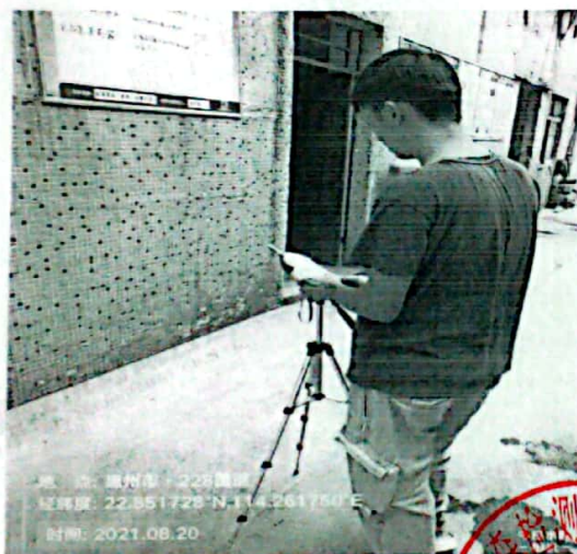
图 3: 厂界西北侧外 1m 处 3#