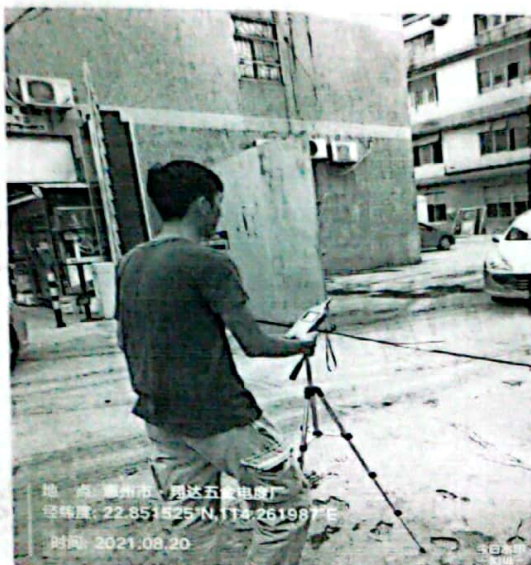
图 1: 厂界东南侧外 1m 处 1#