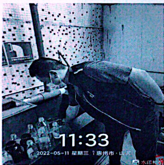
图 1: 废水排放口