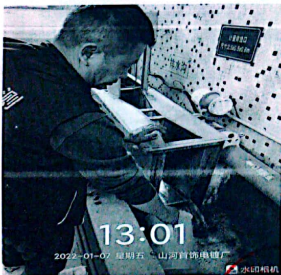
图 1: 废水排放口