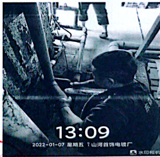
图 2: 车间排水口