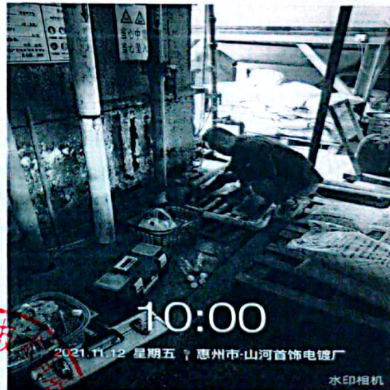
图 2: 车间排水口