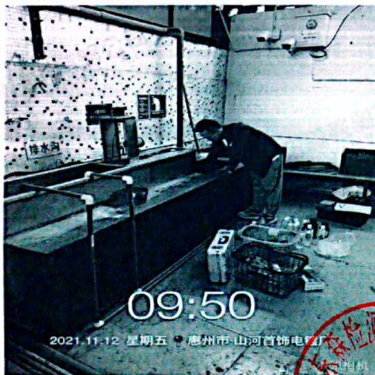
图 1: 废水排放口