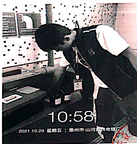
图 1: 废水排放口