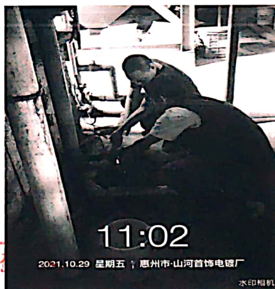
图 2: 车间排水口