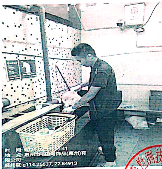
图 1: 废水排放口