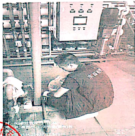
图 2: 车间排水口