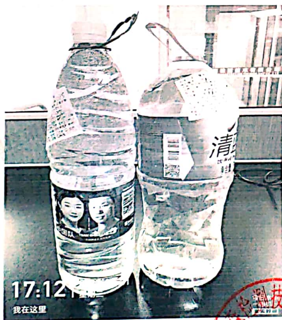
图 1: 送检样品