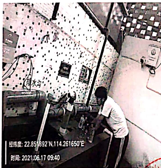
图 1: 废水排放口