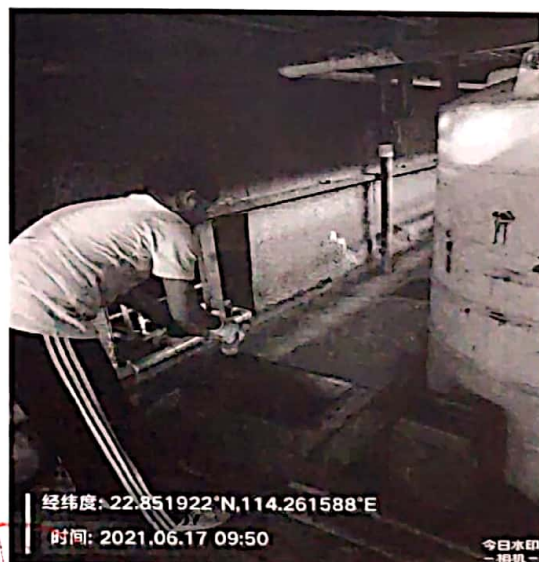
图 2: 车间排放口